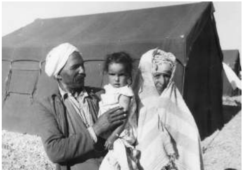
Une famille de Harkis au camp de Rivesaltes