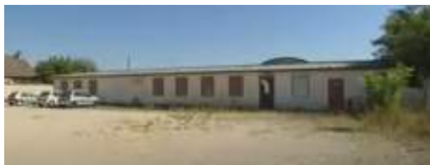
Les vestiges du camp SNCF de Gevrey-Chambertin - Source France 3 © Reportage septembre 2010