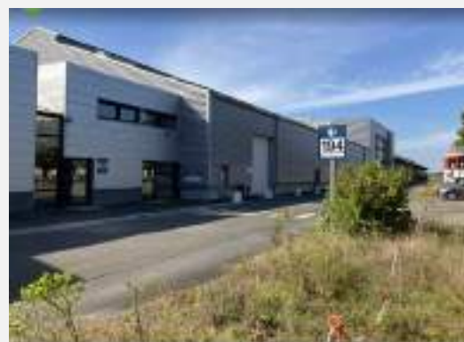
Centre historique SNCF les Archives du SARDO au Mans