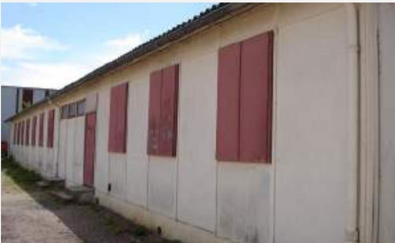
Le camp SNCF de Gevrey-Chambertin - 2012