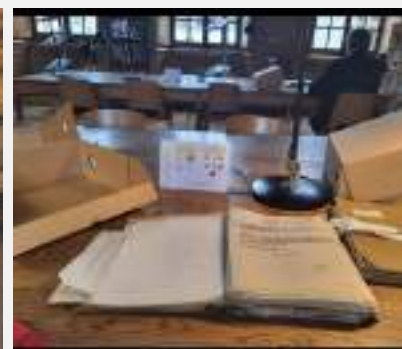
Les archives AD 21