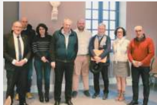
Une partie des membres du groupe projet en mars 2023 De gauche à droite : le directeur de l'ONaCVG 21, les représentants de la municipalité d'Is-sur-Tille, le conseiller départemental et les représentants associatifs