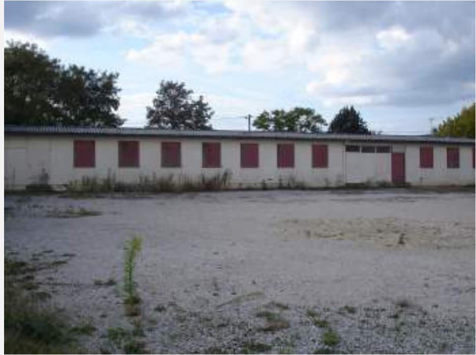
Le camp SNCF de Gevrey-Chambertin - 2012