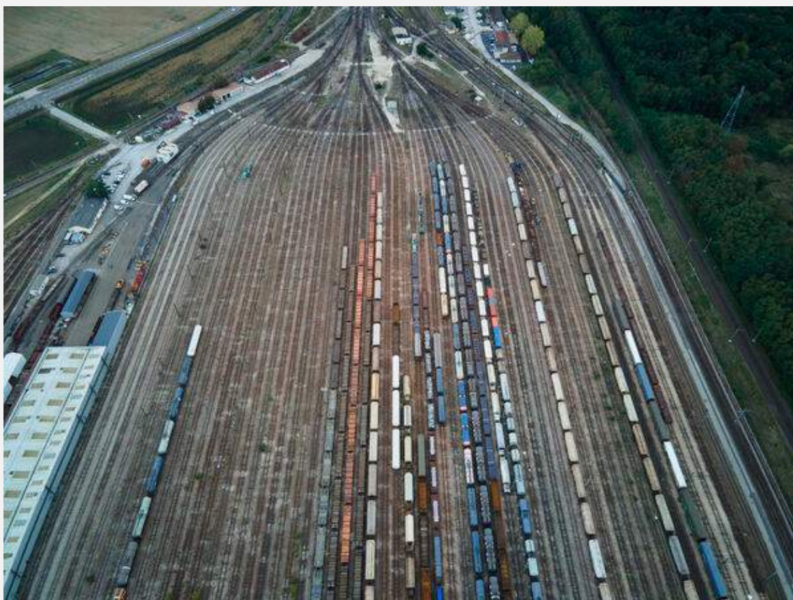
Le triage de Gevrey-Chambertin