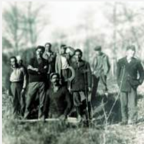
Les Harkis d'Is-sur-Tille, en forêt domaniale de Val-Suzon - 1965