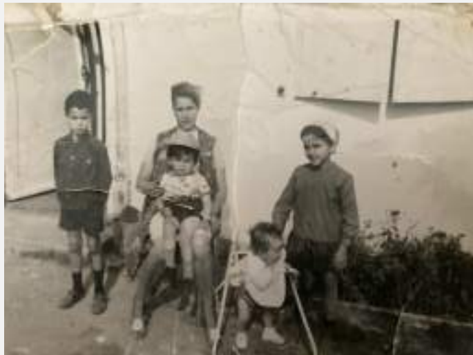
Les femmes et enfants de Gevrey

Pour le 60ème anniversaire de leur arrivée , nous souhaitons organiser une commémoration locale, articulée autour de :