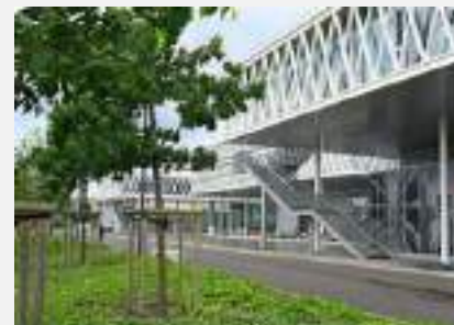
Les archives nationales de Pierrefitte sur Seine